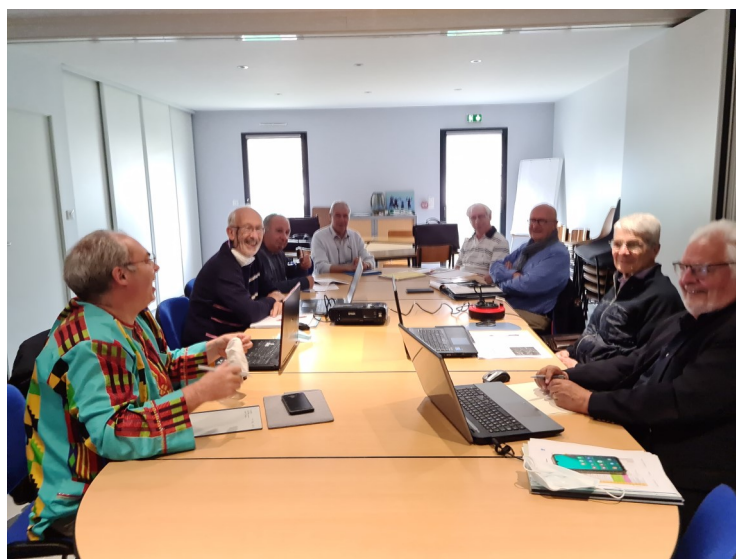
Quelques membres des commissions lors de la CF du 03/06/21 après avoir retiré leurs masques !

Mercredi 9 juin 2021, la new's letter du Diocèse annonçait les nominations des prêtres. A cette occasion, nous avons le plaisir de souhaiter la bienvenue aux prêtres qui rejoignent les paroisses adhérentes au GSP. Nous reprendrons contact avec eux afin de leur faire découvrir son organisation et fonctionnement.