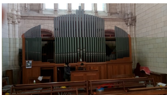
Rénovation de l'orgue de l'église Saint Nazaire